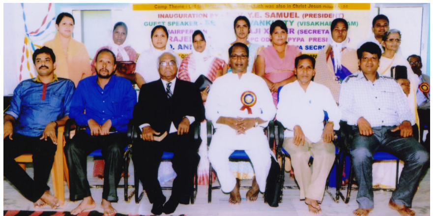
ഐപിസി ഒറിസാ സ്റ്റേറ്റ് എക്സിക്യൂട്ടീവിനോടു ചേർന്ന് ഐപിഡബ്ല്യുഎ കൗൺസിൽ മെമ്പേഴ്സും പിരവൈപിഎ പ്രസിഡന്റ് സെക്രട്ടറിയും.