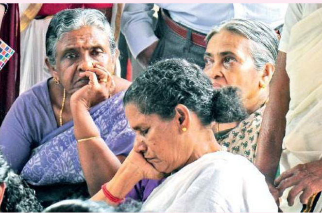
ദുരിതകയെത്തിൽ നില കാണാതെ: കേരളത്തിൽ കഴിഞ്ഞ ആഴ്ചകളിൽ സാമ്പത്തിക ക്രമീകരണങ്ങളുടെ ഫലമായി ദുരിതം അനുഭവിക്കുന്നവർ വളരെയുണ്ട്. പണം ഉണ്ടെങ്കിലും അത് ഉപയോഗിക്കാൻ പറ്റാത്ത അവസ്ഥ. പരിഹാരം തേടിയുള്ള യാത്രയ്ക്കിടയിൽ വിവശരായി വീശുമിക്കുന്ന വീട്ടമ്മമാർ.