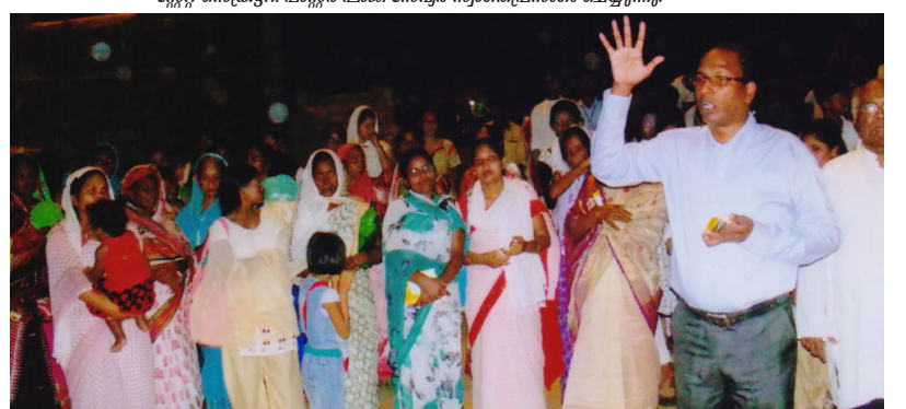
സി ഷോറിലെ ഒരു പരസ്യയോഗത്തിനിന്ന്.